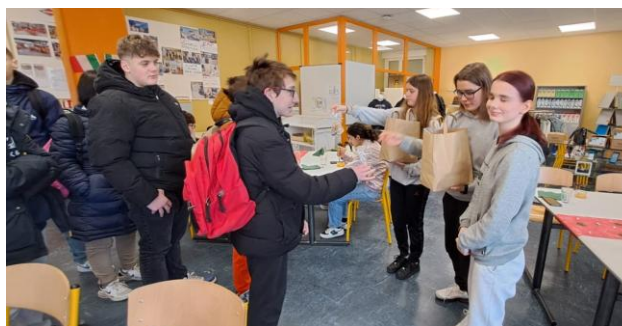
Les élèves de CAP ont offert des cookies aux élèves de 311.

Les élèves de 1 ère année Production Service en Restaurations du lycée Jules Verne se sont rendus au collège pour rencontrer les élèves de 3 ème SEGPA, le vendredi 31 janvier.