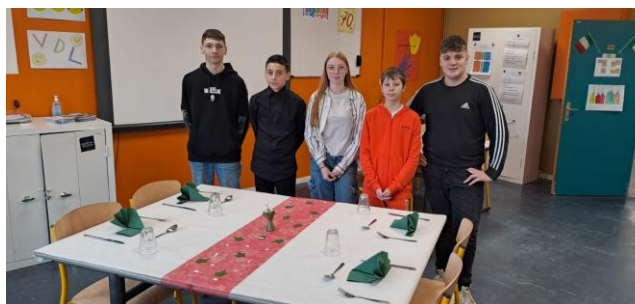
Mise en place du restaurant pédagogique