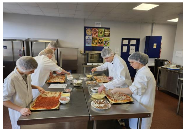
Préparation des pizzas